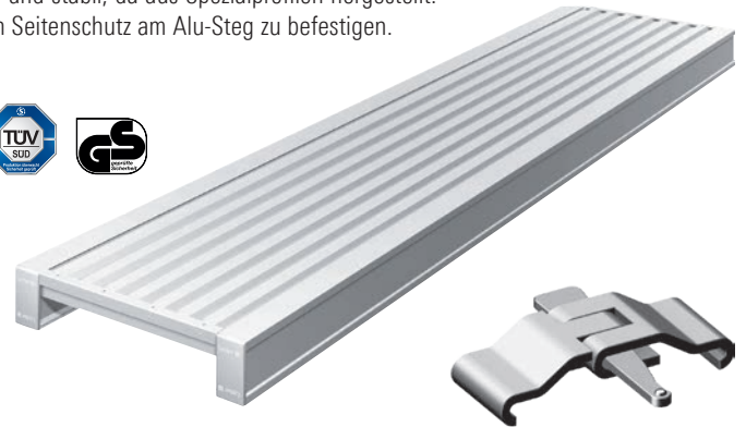
1331.000 Klammer siehe Seite 113.

Der Alu-Steg 600 faltbar ist ebenso in Lastklasse 2 einsetzbar. Eine Klappvorrichtung ermöglicht das Zusammenlegen zu handlichen Transportabmessungen.